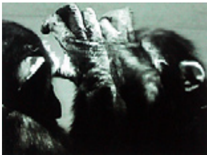
Ode an das Verlassene Haus