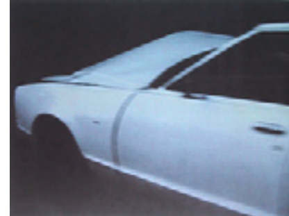
Worte an Europa