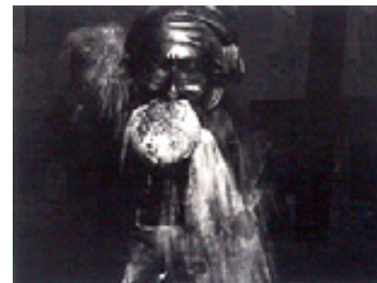
Der Morgen in Berlin