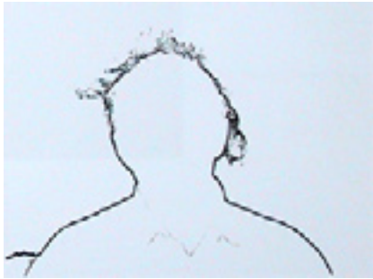
Hört mich an