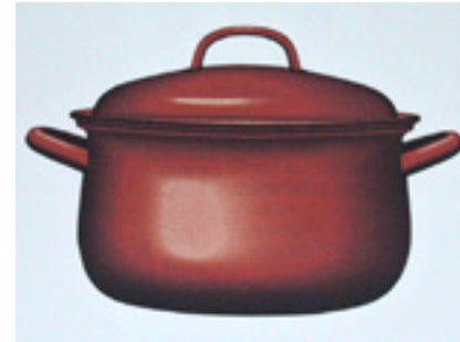
Das Haus der Oden