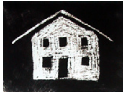
Ode an die Erde (II)